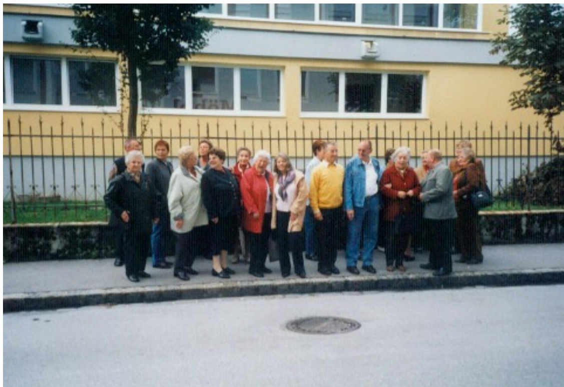
Senioren, abreisefertig zum Puppenmuseum

31. 7. Seniorenausflug in das Puppenmuseum nach Obertrum. Anschließend gab es eine gemütliche Einkkehr beim Goiserwirt/Viktor Leitgeb.