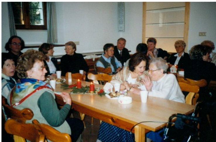
30.11. Weihnachtsfeier der KLM Salzburg im Lainerhof

16. 12. Weihnachtsfeier der Senioren im Vereinsheim der KLM Salzburg.